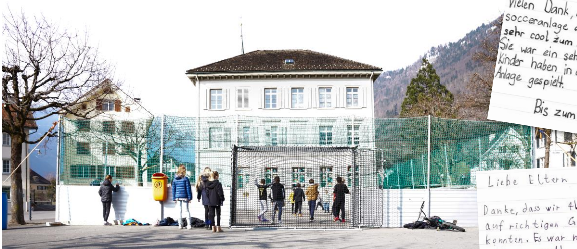
Streetsoccer-Anlage im März 2023 auf dem Pausenplatz in Ennenda

Während eines Monats wurde die Anlage der offenen Jugendarbeit Glarnerland sowohl während der Schulzeiten als auch in der Freizeit intensiv genutzt. Das Projekt war ein voller Erfolg und hat zum Entschluss geführt, die Anschaffung einer eigenen Anlage für Ennenda in Angriff zu nehmen.