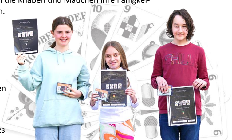
Gewinner:innen des Jassturniers 2023