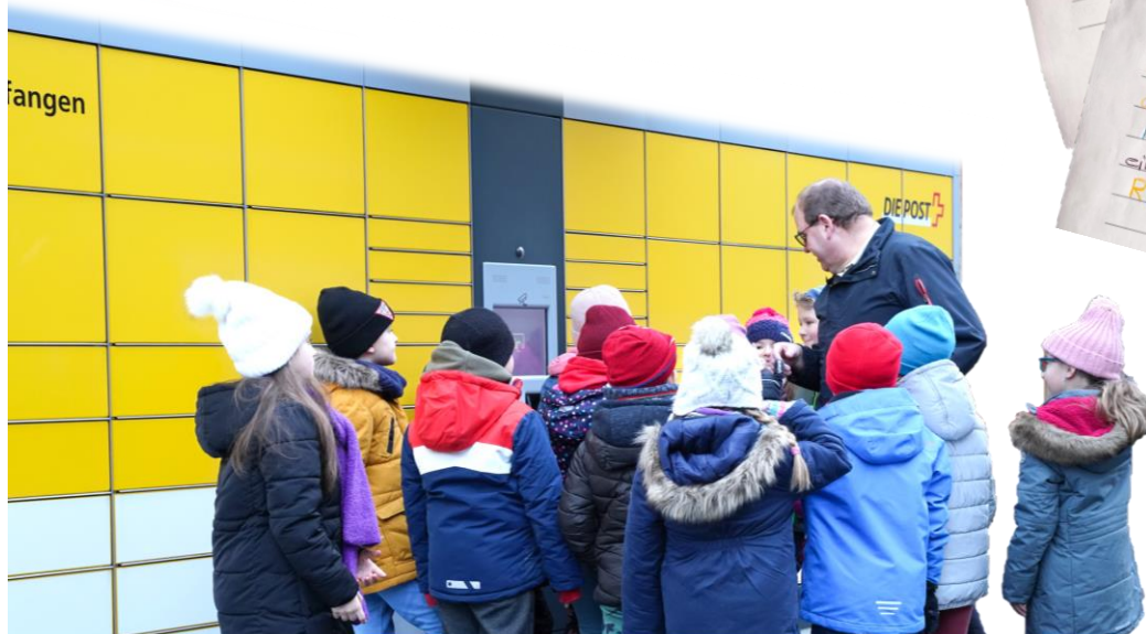
Besichtigung der Post Exkursion 2. Klasse