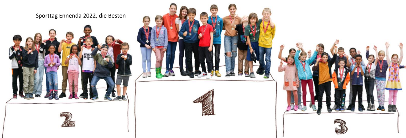
Sporttag Ennenda 2022, die Besten

Die Elternmitwirkung und insbesondere die Einführung an den einzelnen Schulen wird das Brennpunkt-Thema der nächsten Schulzeitung sein. Ab August werden sich dann die Elternteams in den Schulen bilden. Die Wahl der Delegierten wird an den einzelnen Elternabenden stattfinden. Die Klassenlehrpersonen werden diese Wahl durchführen. Das Reglement zur Elternmitwirkung wird im Juli auf der Webseite der Schulen aufgeschaltet. Es liefert weitere Informationen zur Elternmitwirkung.